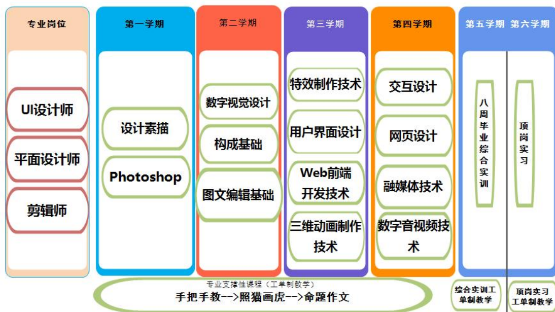
图 8-1 课程体系构建图