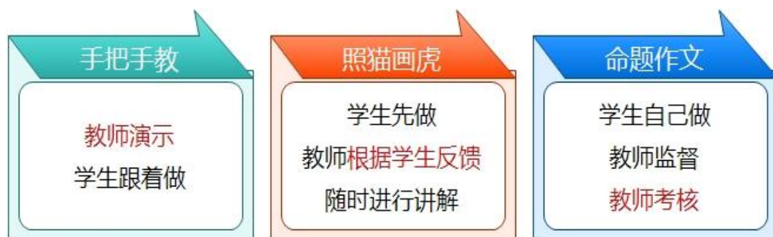
图 8-3 工单制教学翻转课堂图

专业课程以课程标准为依据，依托校内外实习实训条件，以工单制教学方式激发学生兴趣，注重“做中学、做中教”。教师利用工单教学资源库，进行课题教学与网络教学。利用课程性工单制教学翻转课堂“三部曲”：手把手教、照猫画虎、命题作文让学生由被动学习变为主动学习，如下图所示。